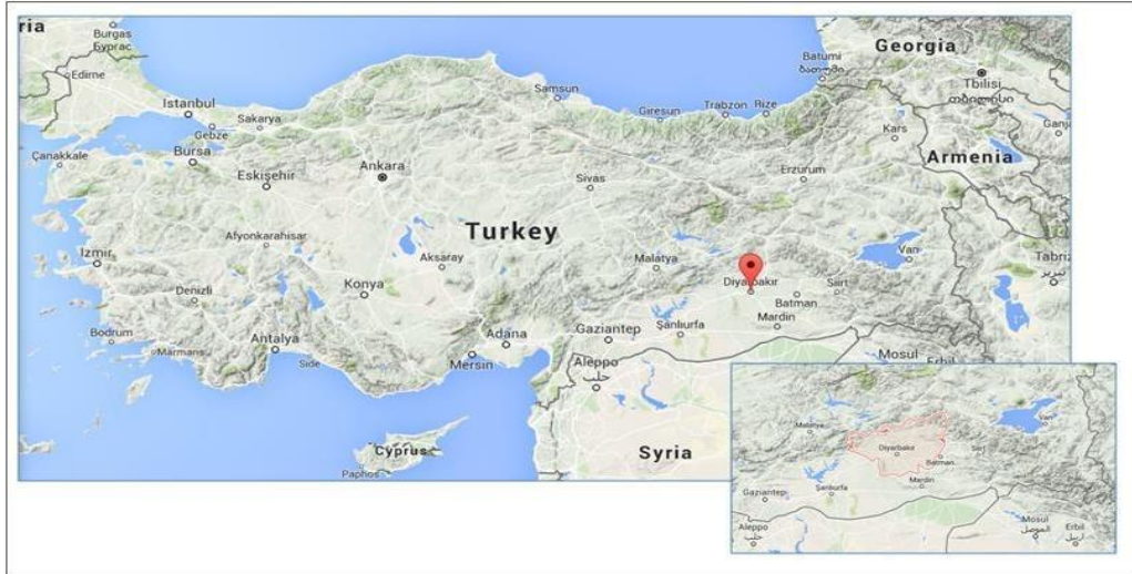
Türkiye haritası üzerinde Diyarbakır'ın konumu ve Diyarbakır il detayı (nüfus: 1.654.196).

Temmuz 2015'te hükümet ile PKK arasındaki ateşkesin sona ermesinden bu yana (Şubat 2016 itibarıyla) en az 355.000 kişi silahlı çatışmalar nedeniyle ilçeyi terk etti, Güneydoğu Anadolu'da yedi ilin en az 22 ilçesinde uygulanan sokağa çıkma yasağından yaklaşık 1.642.000 kişi etkilendi.