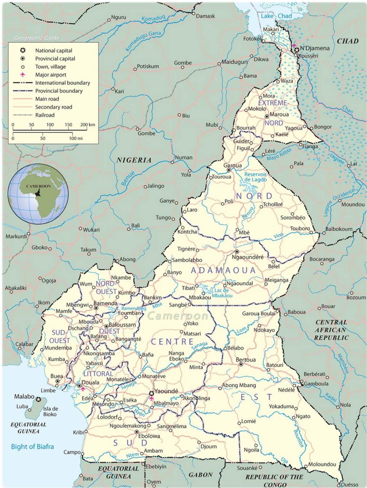
Figure 2 : Carte de la République du Cameroun.