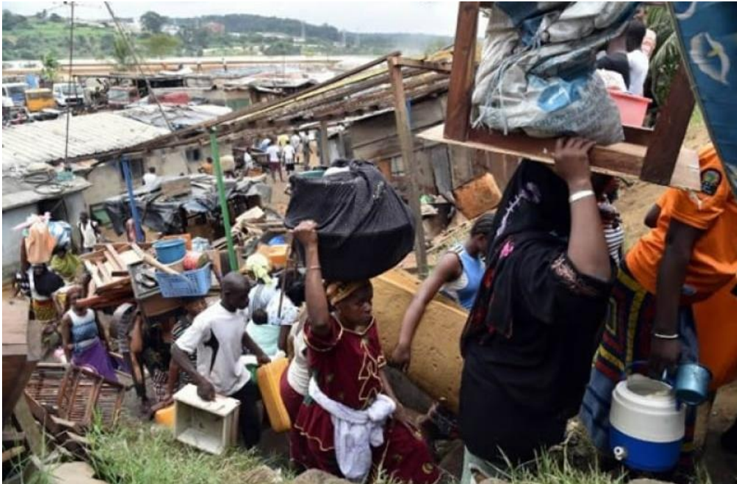
Figure 1 : Habitants de la Vallée de Berrengue en train d'expulsion avec le peu de leurs qu'ils peuvent porter à la main.

Pour le moment, ces victimes n'ont eu aucune assurance d'obtenir un autre logement, encore moins une compensation alternative. C'est ainsi que depuis le 5 janvier 2023, de nombreuses familles sont dans la détresse et la désolation. En attendant, les autorités étant restées évasives, sinon muettes, sur la question.