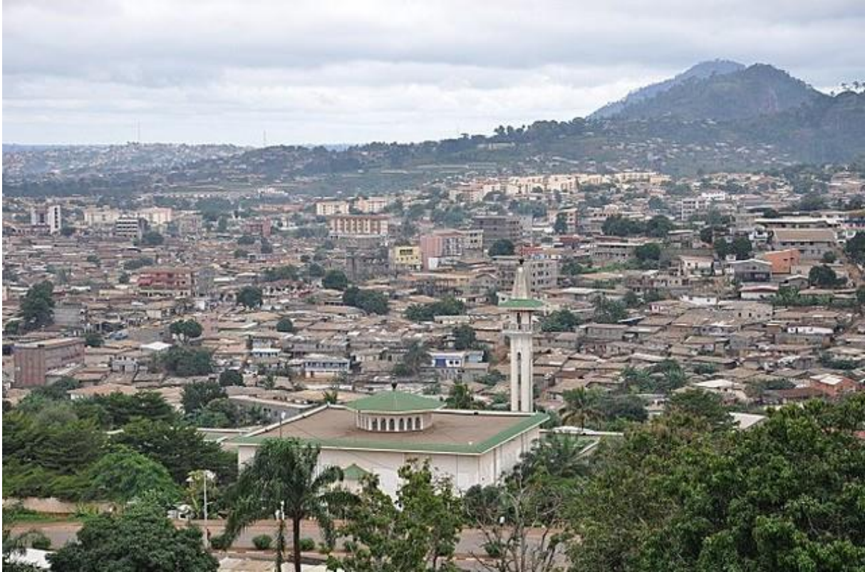
Une vue de Briqueterie.

d'Armes à Feu conformément à la loi les fonctionnaires mise en vigueur (1990). La Charte africaine sur l'Humain et les Droits des Gens affirme ces mêmes principes, en particulier sous l'Article 6. Dans le cas du Cameroun, l'état a non seulement violé ses engagements envers ce traité, mais n'a également pas informé la population affectée et n'a fourni aucune alternative soutenable, ni compensation monétaire, ni logement alternatif.